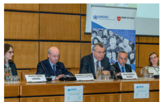
Opening of the conference by Yury Fedotov, Executive Director of UNODC.