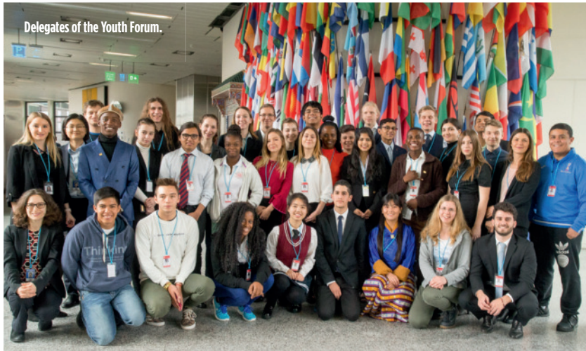
Delegates of the Youth Forum.