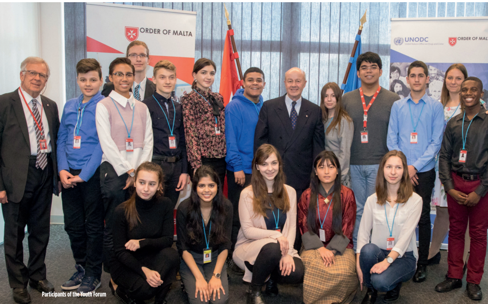
Participants of the Youth Forum