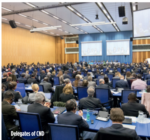
Delegates of CND

maßnahmen zur Drogenprävention in ihren Heimatländern über individuelle Fördermaßnahmen, Informationskampagnen, Jugendveranstaltungen und Aktivitäten in den sozialen Netzwerken, um so jeden Tag Millionen Menschen zu erreichen.